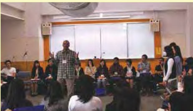
それぞれの参加青年がどのような教育的リーダーを目指しているのかを共有し、コースでの到達目標を発表する（教育コース）