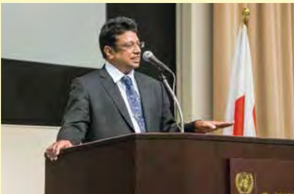
スリランタ・ヘーラト博士による講義