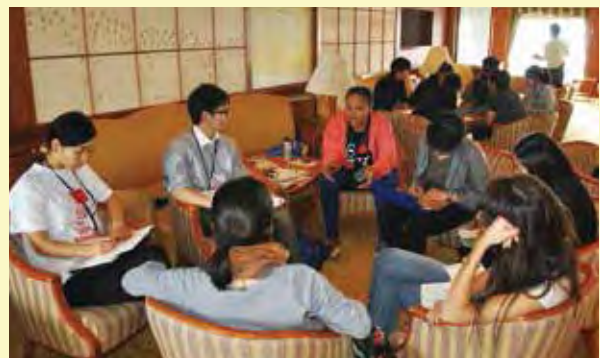
地域の資源をいかし、地球環境に負荷をかけない社会を実現する方法について、各国の取組から学ぶ（環境コース）