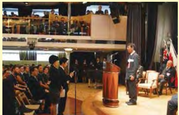
小野田壮大臣官房審議官に出航の挨拶をする日本のナショナル・リーダーとサブ・ナショナル・リーダー