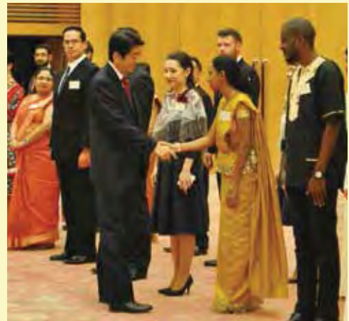
安倍晋三内閣総理大臣表敬訪問