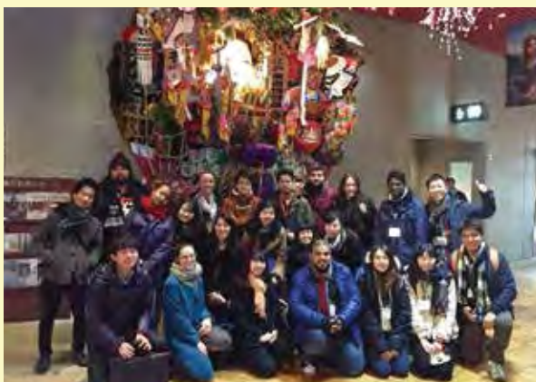
江戸東京博物館を見学する参加青年