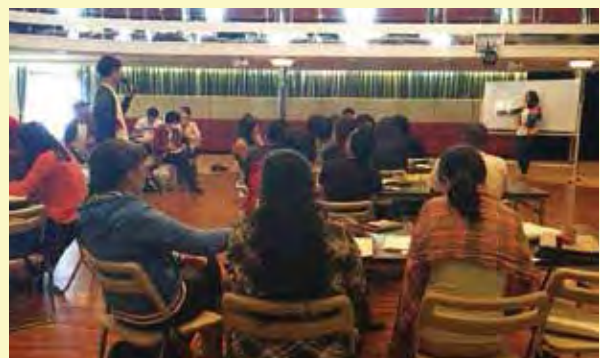
「社会に貢献する起業」をテーマに、チーム対抗のビジネスプランコンテストを実施（青年起業コース）