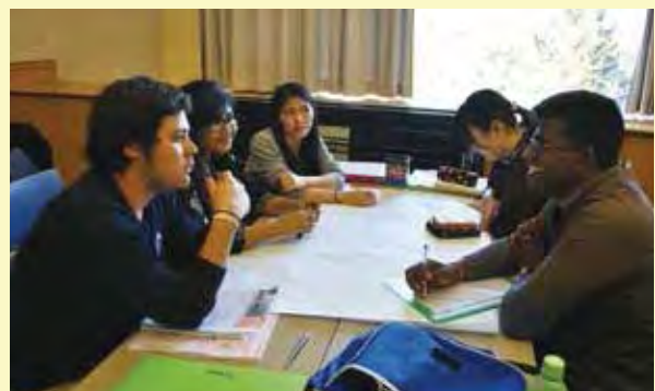
自分たちが暮らす地域における自然災害の特徴を紹介し合い、各国の災害事情を比較する（防災コース）