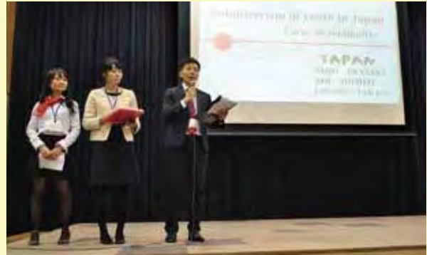
日本参加青年がボランティア活動の継続性に焦点をおいて発表