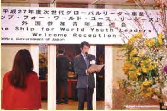
高木宏壽内閣府大臣政務官からの挨拶