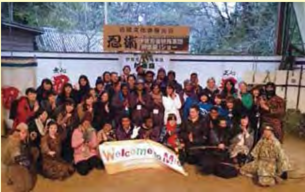
忍者ショーを鑑賞し、忍者について学ぶ（三重県）