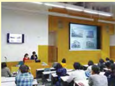
株式会社HITOTOWA Neighbors Next U26 Project 日本の家族と住まいの現状・問題・解決策について学ぶ(地域づくりコース)