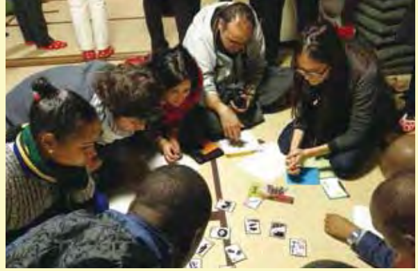
南昌荘での日本文化体験（岩手県）