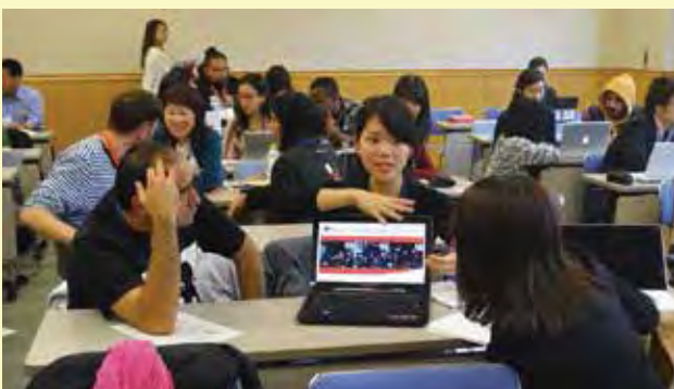
参加青年が持ち寄ったCMや広告などのメディアを題材に、各国のメディアを取り巻く課題について議論する（情報・メディアコース）