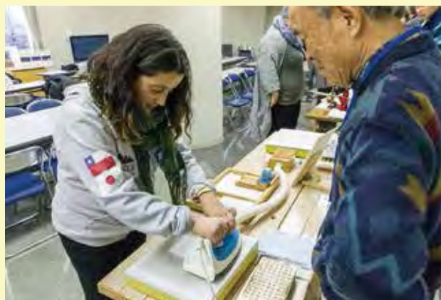
紙の博物館にて紙すき体験をする