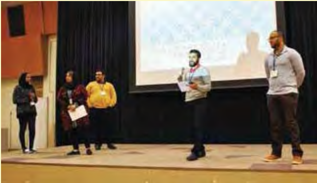
バーレーンで参加青年が関わっている四つのボランティア活動の紹介