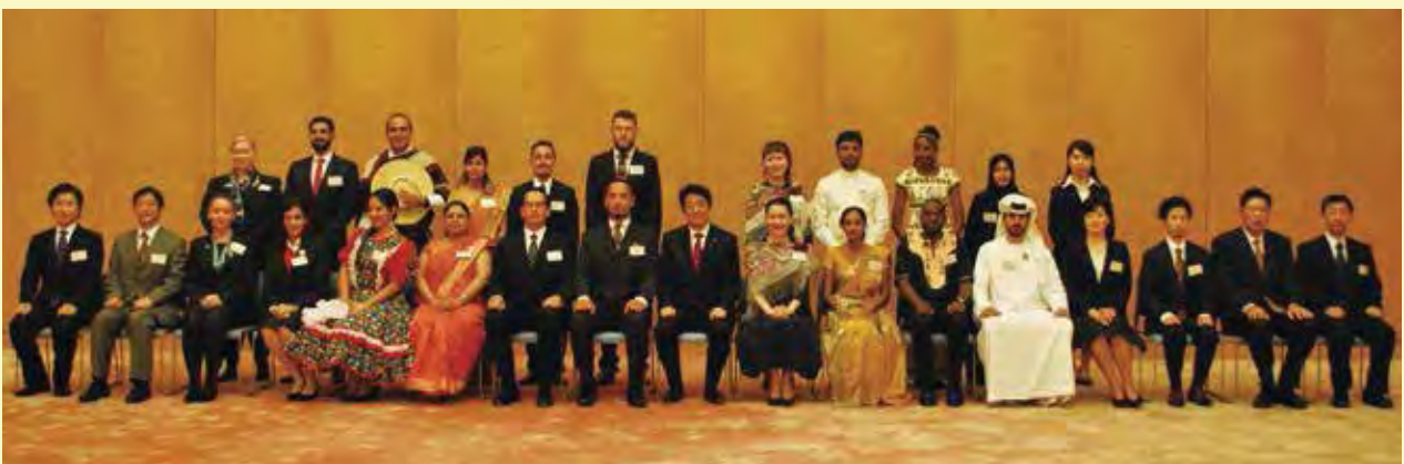
(写真は内閣官房内閣広報室提供)