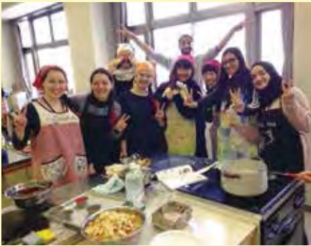
山梨英和中学校・高等学校での調理実習体験（山梨県）