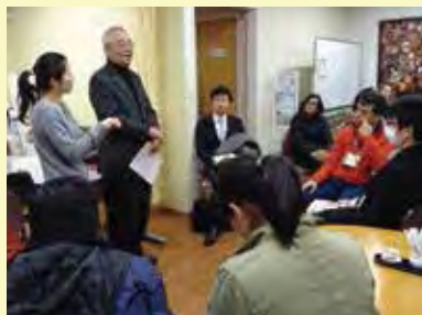
いたばしコミュニティスペース連絡会 高島平団地のコミュニティカフェを4軒訪問し、地域の活性化のためにカフェ経営を始めた経緯を伺う(地域づくりコース)