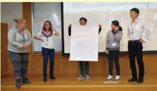
与えられた地域課題の事例を基に、解決案となるプロジェクトを提案する（地域づくりコース）