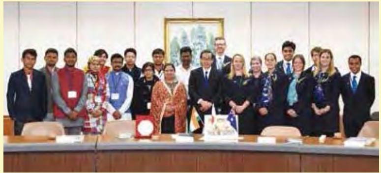
西川一誠福井県知事表敬訪問（福井県）