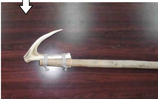
【写真：白糠アイヌ協会 シカ角製アブ（かぎ）】

※かぎはふつう「ながしかぎ」と言われているもので、川をのぼってくるサケなどを捕った。かぎを上向きにして、川の流れにそって流し、魚が近づいたら柄を引いて引っかける。