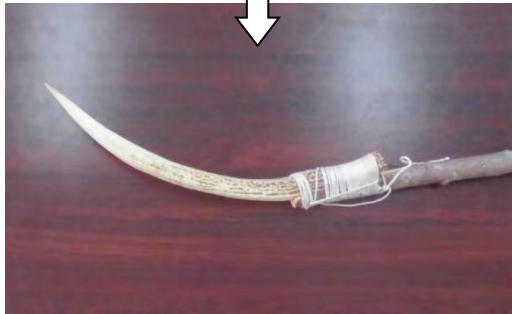
【シカ角製アブ（やす）】

※シカ角製のやすは、アイヌに鉄の道具が伝わる以前からあるものと考えられ、サケのほかにも、秋に川をのぼるアメマス獲りにも使われた。アメマスは、産卵を終えて再び海へもどるものを獲った。【参考文献：『シラリカ コタン』シラリカコタン編集委員会（2003年）】