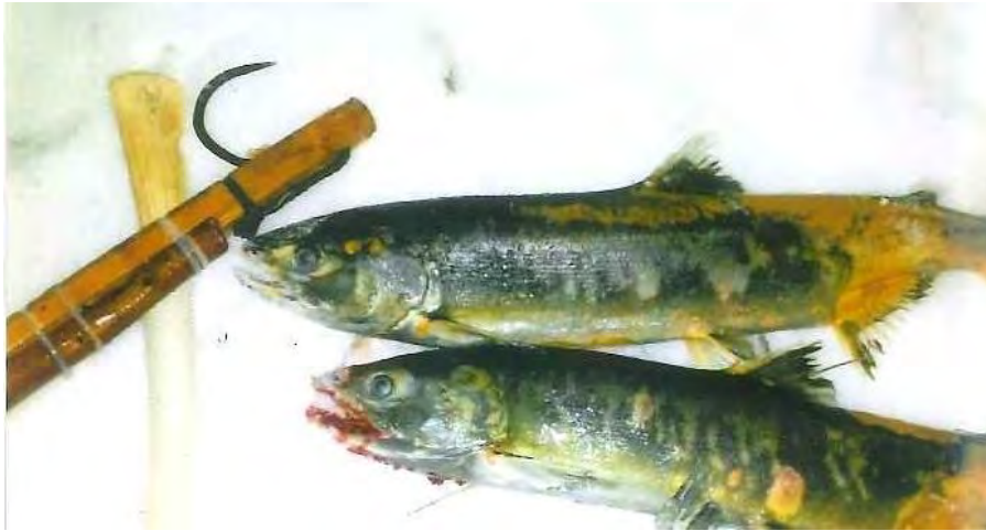
【出典：平成 30 年度 白糠アイヌ協会による特別採捕記録 写真左の道具がマレク】