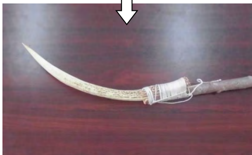
【写真：白糠アイヌ協会 シカ角製アブ（やす）】

※シカ角製のやすは、アイヌに鉄の道具が伝わる以前からあるものと考えられ、サケのほかにも、秋に川をのぼるアメマス獲りにも使われた。アメマスは、産卵を終えて再び海へもどるものを獲った。【参考文献：『シラリカ コタン』シラリカコタン編集委員会（2003年）】