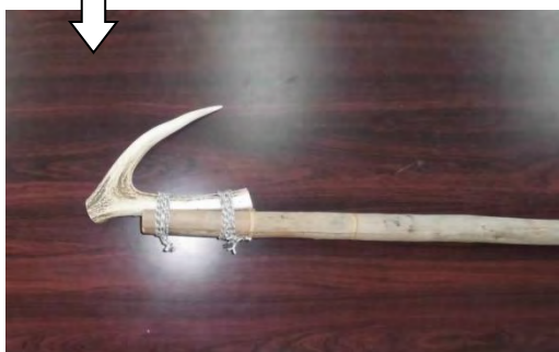
【写真：白糠アイヌ協会 シカ角製アブ（かぎ）】

※かぎはふつう「ながしかぎ」と言われているもので、川をのぼってくるサケなどを捕った。かぎを上向きにして、川の流れにそって流し、魚が近づいたら柄を引いて引っかける。【参考文献：『アイヌの民具』萱野 茂（1978年）】