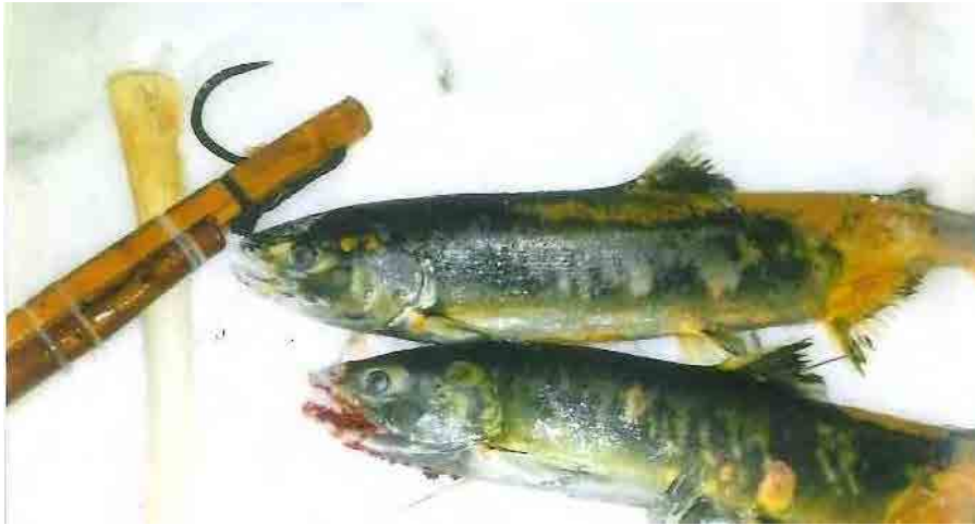
【出典：平成 30 年度 白糠アイヌ協会による特別採捕記録 写真左の道具がマレク】