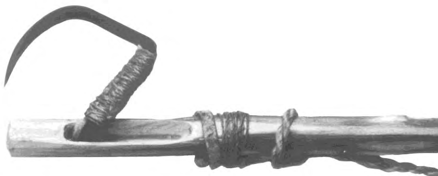
【出典：『アイヌの民具』萱野 茂（1978 年）】