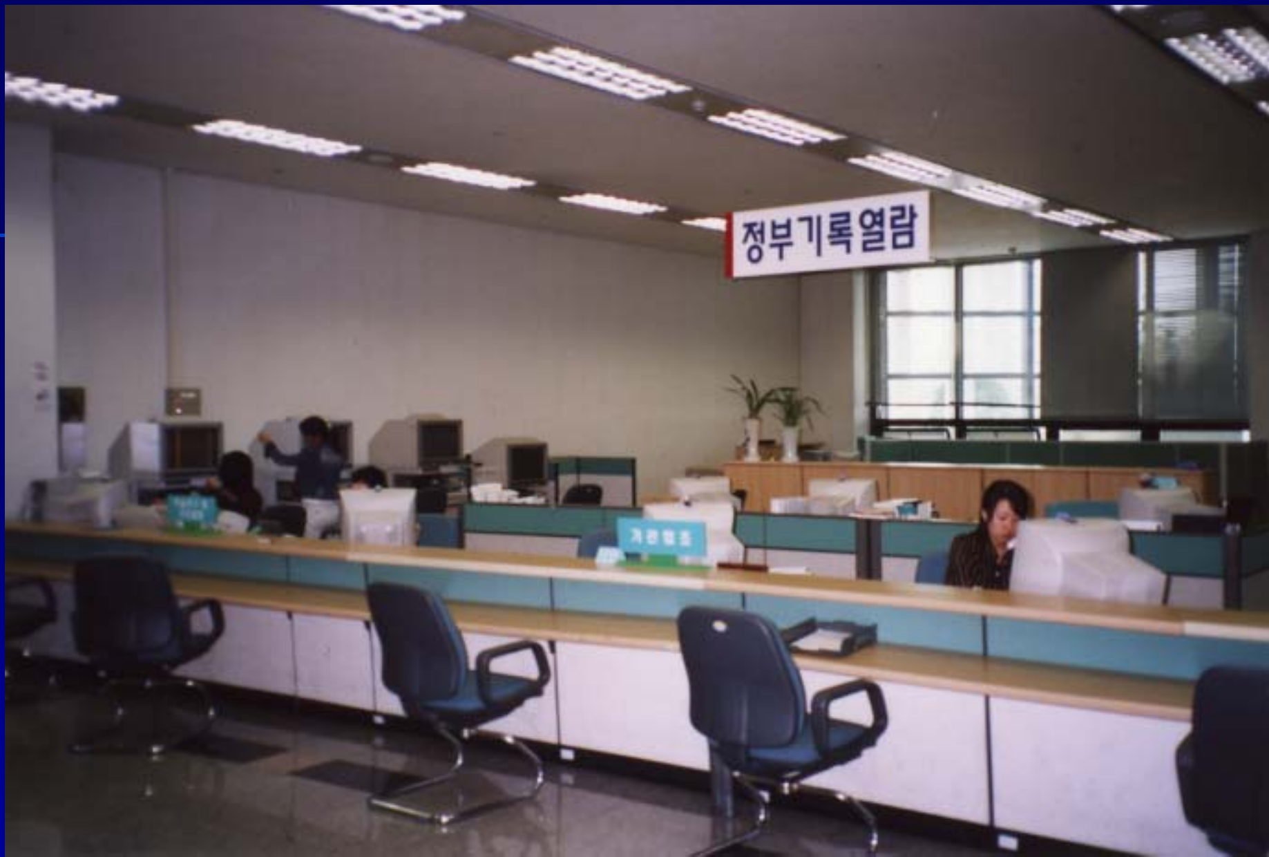
韓國政府記錄保存所閱覽室