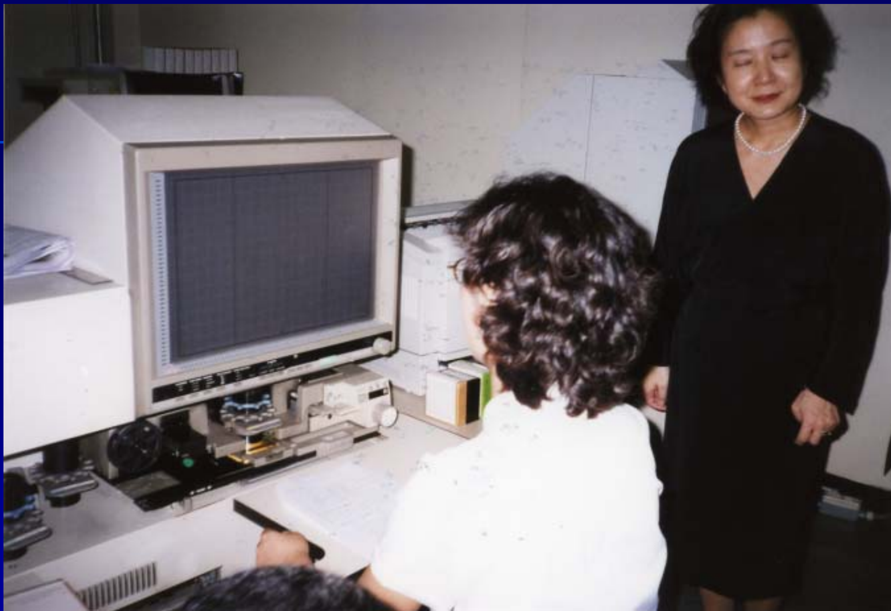
マイクロリーダー・プリンターで閲覧・複写