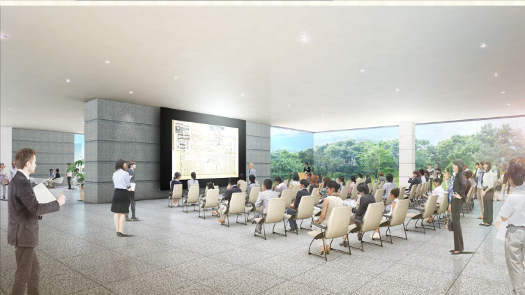
レセプション等も開催できる、皇居を望む1階来館者用スペース