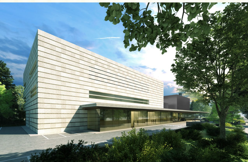
国立公文書館北西側外観