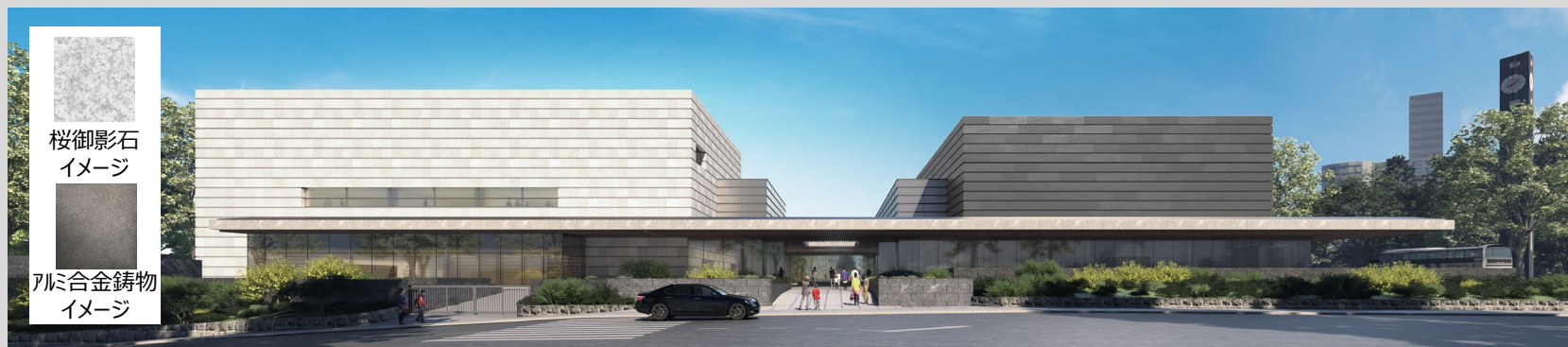
【国立公文書館及び憲政記念館西側外観】