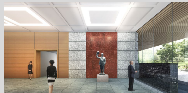
【憲政記念館中央ロビー及び尾崎行雄像】