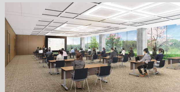
【議員会議室：150名程度】