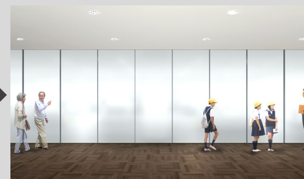
【修復作業室：通常作業時】