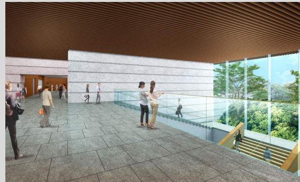
【エントランスホール及び大階段】