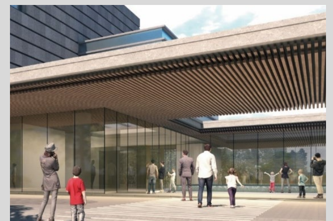
【エントランス軒裏の木材】