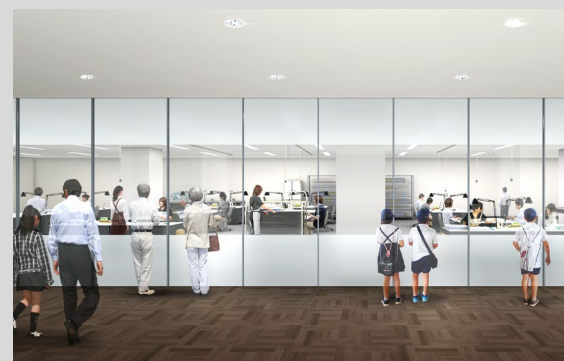
【修復作業室：公開時】