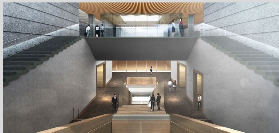
【展示ホール・大階段】