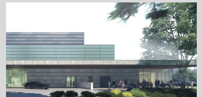
【テラス・食堂：120席程度】