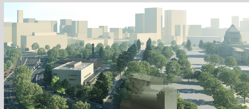
【永田町・霞が関地区の景観】