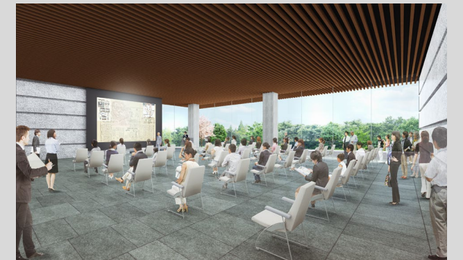
【1階来館者スペース：利用可能人数100名程度】