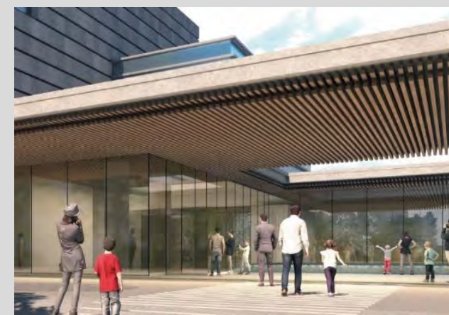
【エントランス軒裏の木材】