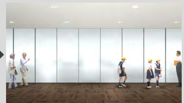
【修復作業室：通常作業時】