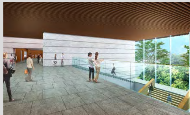
【エントランスホール及び大階段】