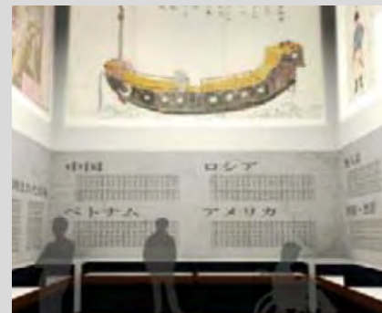
【デジタル展示のイメージ】