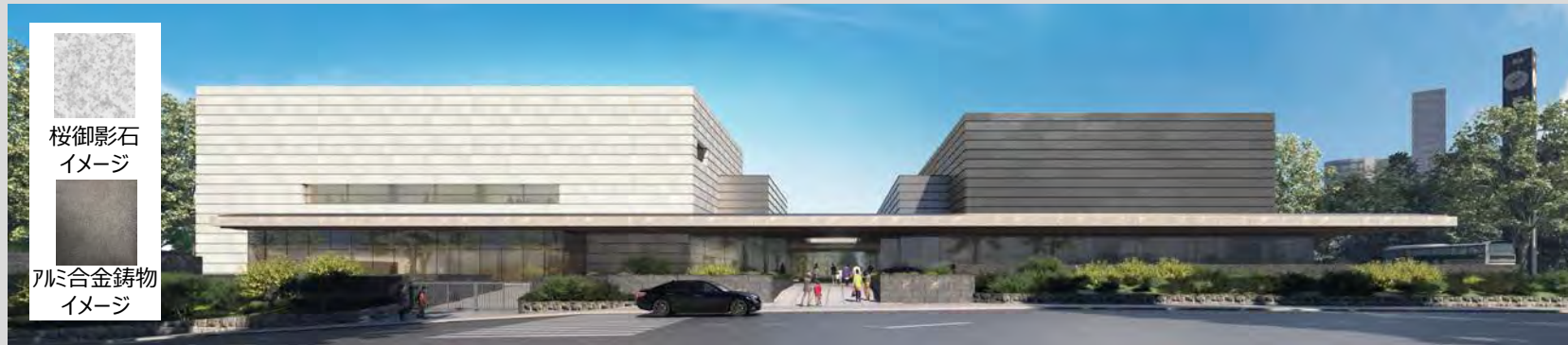
【国立公文書館及び憲政記念館西側外観】