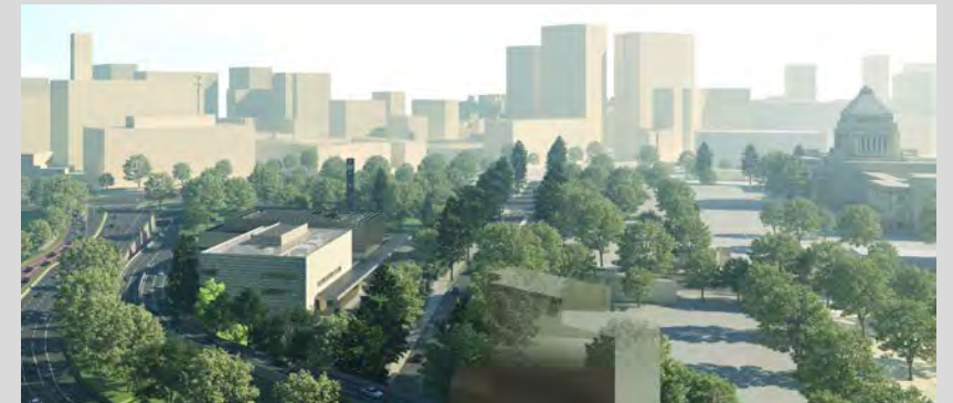
【永田町・霞が関地区の景観】