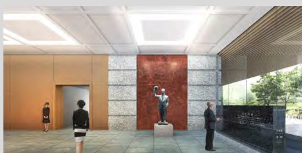
【憲政記念館中央ロビー及び尾崎行雄像】