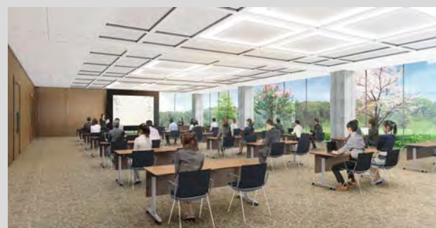
【議員会議室：150名程度】