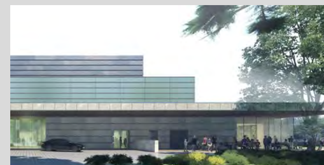
【テラス・食堂：120席程度】