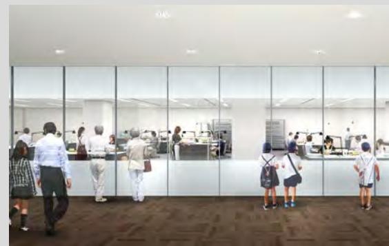
【修復作業室：公開時】