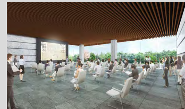
【1階来館者スペース：利用可能人数100名程度】