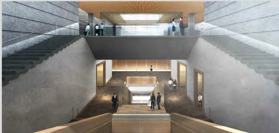
【展示ホール・大階段】