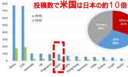
第31回米国人工知能学会投稿論文数