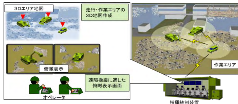
複数車両等の情報統合による環境認識向上技術の研究（イメージ）

*2 複数車両のセンサで取得した地形情報等の統合により、経路啓開等の各種作業の迅速化を可能とする技術