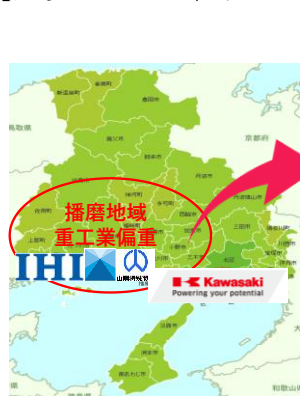
重工業中心の産業