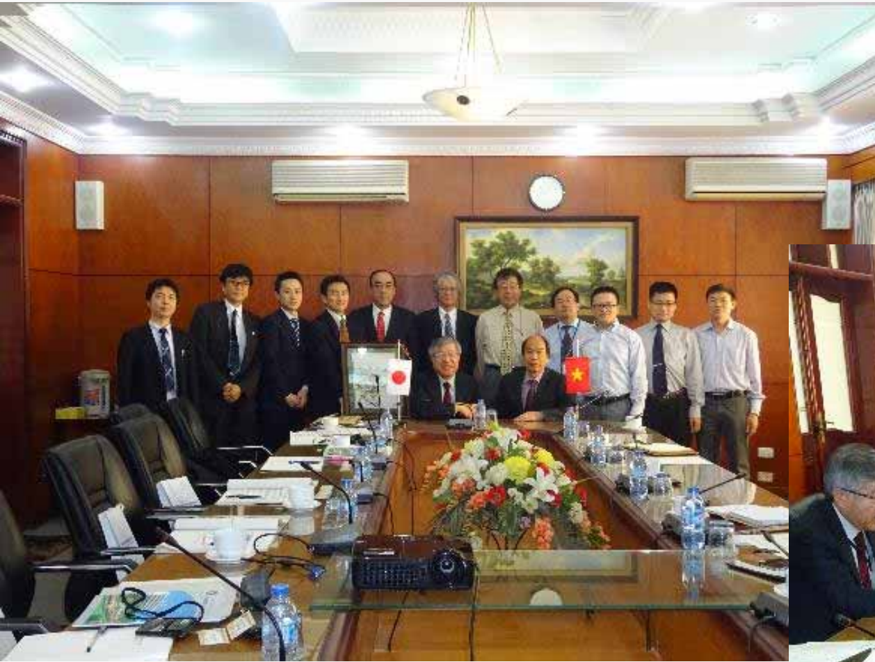
UTC学長（Prof.Dr.Tran Dac Su）との記念写真