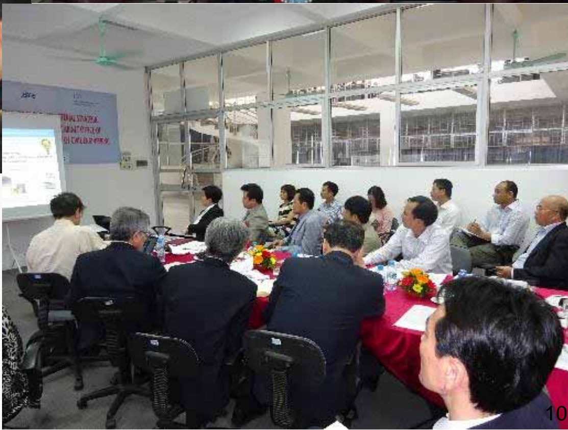
情報・意見交換時の風景