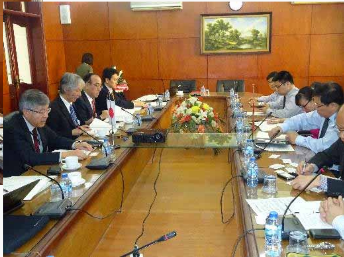
情報・意見交換時の風景