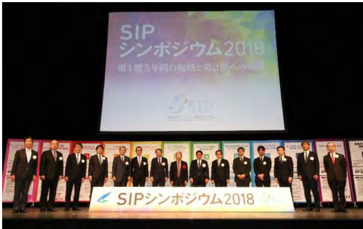
図 4-3 第2期 PD によるフォトセッション