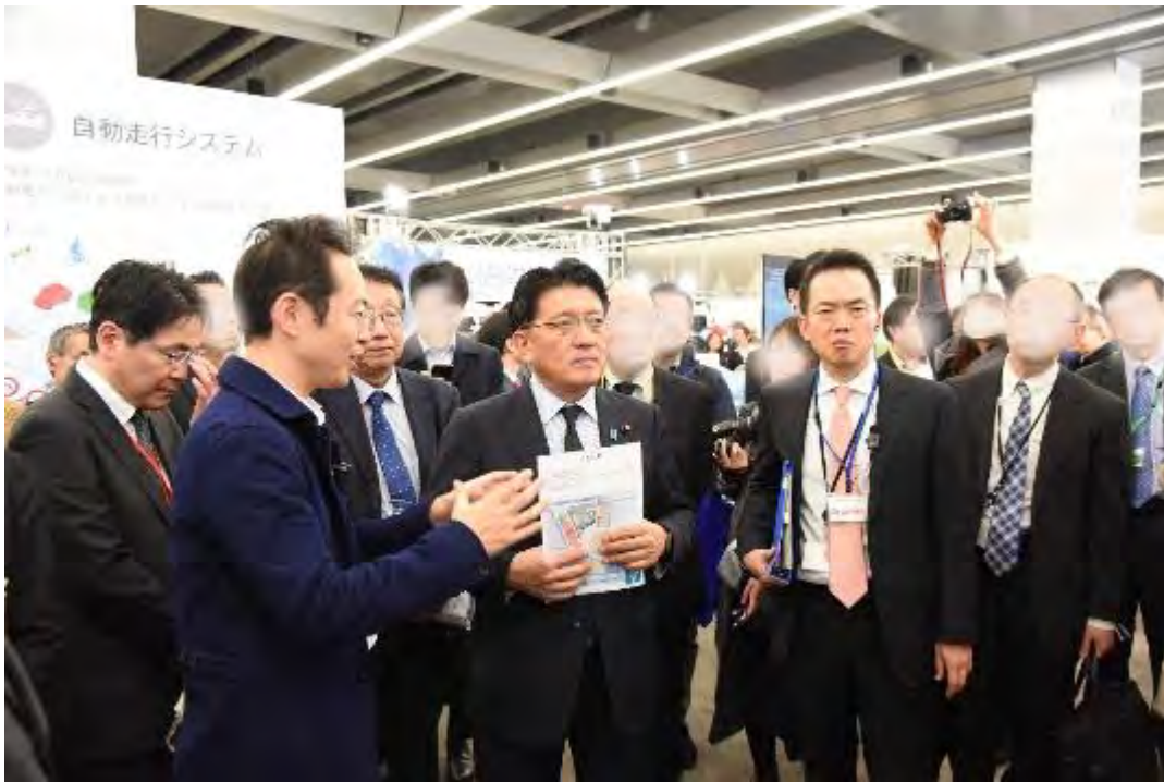
図 4-5 展示の説明を受ける平井大臣