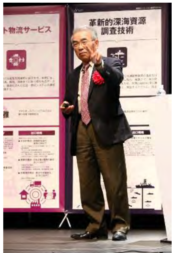
図 4-2 金出 武雄教授による基調講演