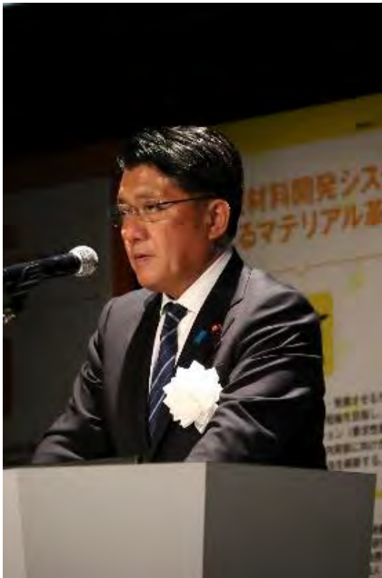
図 4-1 平井大臣による挨拶