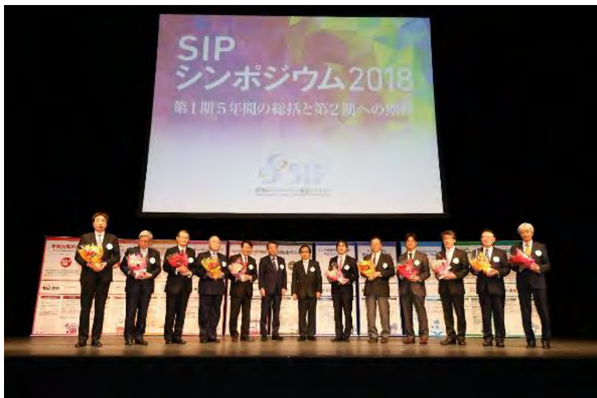
図 4-4 第1期 PD によるフォトセッション