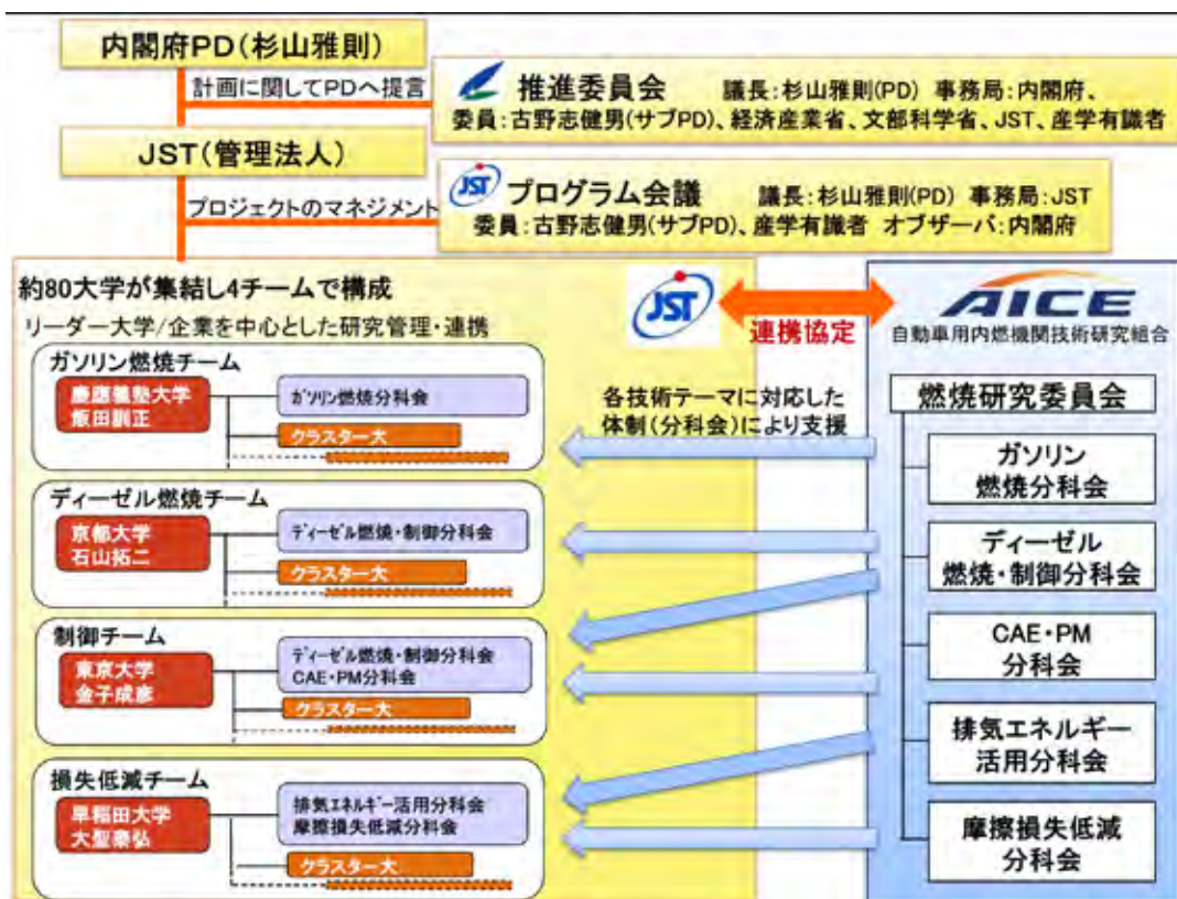
図 5-3 革新的燃焼技術の研究体制

例えば、革新的燃焼技術では、図 5-3 に示すように業界の団体である AICE が事前に設立されており、AICE が研究体制に入り込み、AICE で検討された産業界のニーズ・課題認識に沿いつつ大学における燃焼分野の研究開発が進められた。このことが大学研究者の意識改革につながったといえる。