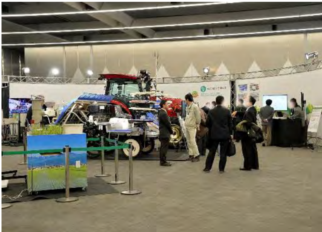
図 4-6 展示会の様子