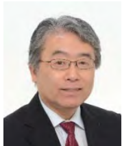
上山隆大議員 (常勤)