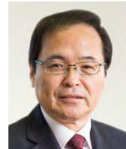
橋本和仁議員 (非常勤)