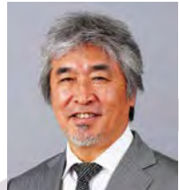
山極壽一議員 (非常勤)