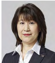
梶原ゆみ子議員 (非常勤)