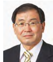
十倉雅和議員 (非常勤)