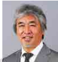
山極壽一議員 (非常勤)