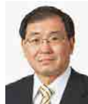
十倉雅和議員 (非常勤)