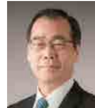
松尾清一議員 (非常勤)