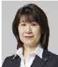
梶原ゆみ子議員 (非常勤)