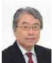
上山隆大議員 (常勤)