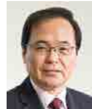
橋本和仁議員 (非常勤)