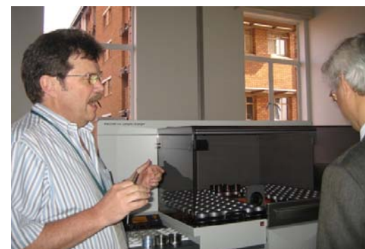
CGSの充実した分析装置と優れた研究リーダー