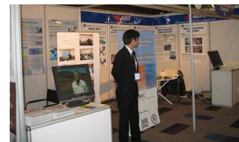
個別バラバラな日本の展示