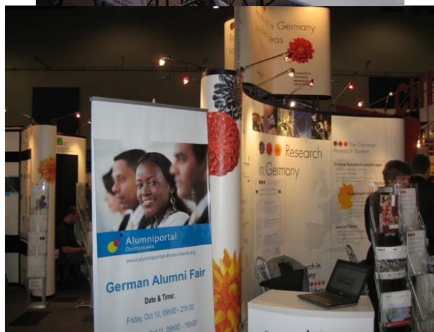
人材育成に向けたドイツの積極的働きかけ