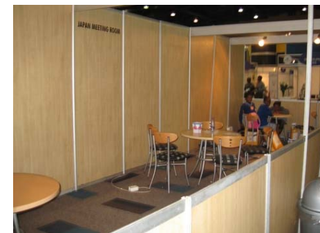
閑古鳥がなく日本の談話スペース