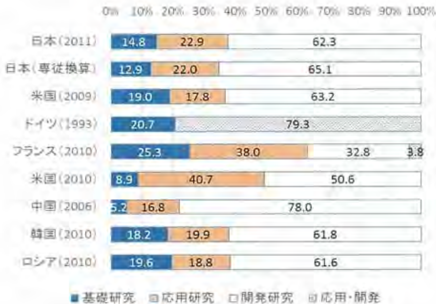
図2 主要国等の性格別研究費割合

(注) 研究資金はOECD.StatExtractsに基づく。3年移動平均値。日本の1995年以前の値は、係数0.64を掛けて補正した値。論文数はトムソン・ロイターInCites TM にもとづく整数カウント法、3年移動平均値。図に示した年は中央年。主要5カ国はカナダ、フランス、ドイツ、イギリス、米国。(出典より転記)