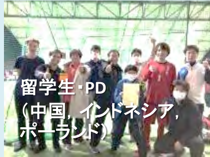
留学生・PD (中国, インドネシア, ポーランド)