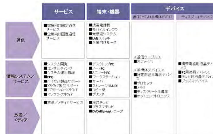
図 1-5：対象とした市場シェアの構成

http://www.soumu.go.jp/main_content/000121696.pdf