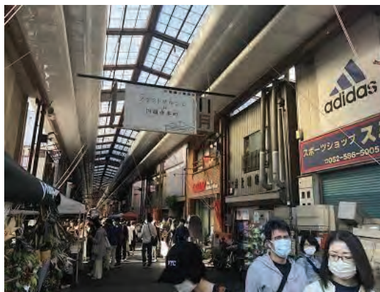
地域との連携強化