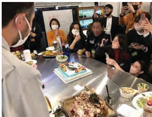
入居者間のコミュニティ強化