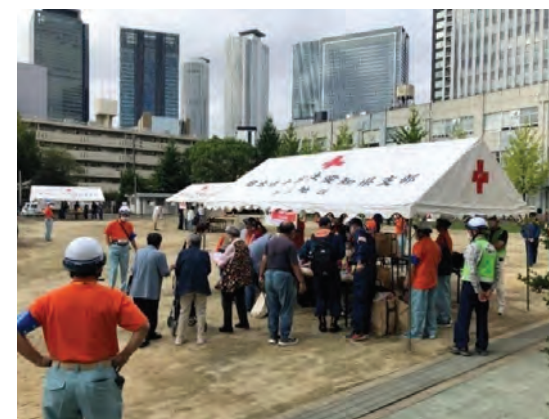
地域イベントへの参加