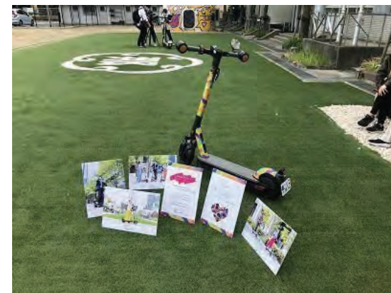
入居者による実証実験をサポート