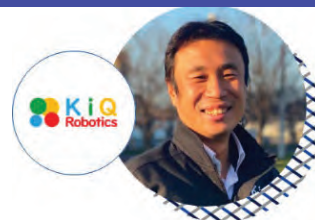
(2) KiQ Robotics株式会社