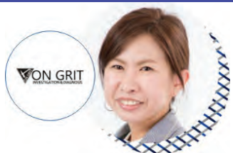
(1) オングリット株式会社

【令和2年度成果】10名を超える新規雇用創出、3件の製品リリース、2件の店舗開設など成長のエンジン機能