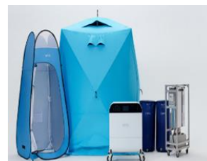
WOTA-BOX (シャワーシステム)