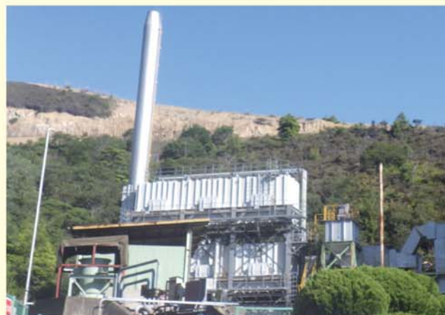
●大容量燃焼試験設備

石炭火力発電所でのアンモニアの燃料利用については、大容量の燃焼試験設備において、アンモニアと微粉炭の混燃試験を実施し、世界最高水準となる熱量比率20%の混燃に成功した。また、中国電力の水島火力発電所2号機にてアンモニア混燃試験を行い、実操業中の石炭火力発電所においてアンモニア1%混燃発電に成功した。