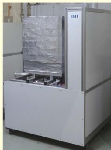
●燃料電池システムの外観

アンモニアを直接燃料としたSOFCで世界初となる1kWクラスモジュールでの発電に成功した。発電効率は56%であり、水素を燃料とした燃料電池と同等の発電効率を達成することで、アンモニアのエネルギーキャリアへの期待を国内外で広める役割を果たした。その後、パッケージ化、自動起動、分解触媒開発、反応器作製、発電システムの構成材料の最適化を行い、平成30年5月に1kW級燃料電池システムを開発した。今後は、水素社会における分散電源としての役割を果たせるよう、装置の大型化を目指して開発を行う予定である。