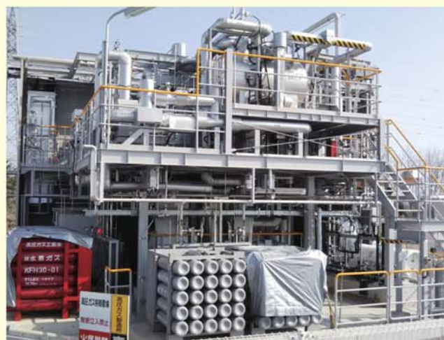
●アンモニア製造パイロット設備の外観

ここでは、低温・低圧下で効率的にアンモニアを合成できる新たなルテニウム触媒とそれに適合するプロセスを開発した。また、太陽光発電由来の電力を用いた水の電気分解によってCO 2 フリー水素を製造し、その水素を原料に、開発触媒を充填した実証試験装置でCO 2 フリーアンモニアを製造し、さらに、そのアンモニアを燃料とするガスタービンで発電(47kW)する試験を行い、CO 2 フリーアンモニアのバリューチェーンを模擬的に実証した。