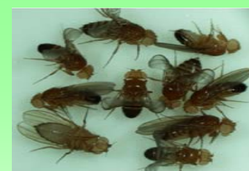
ショウジョウバエ