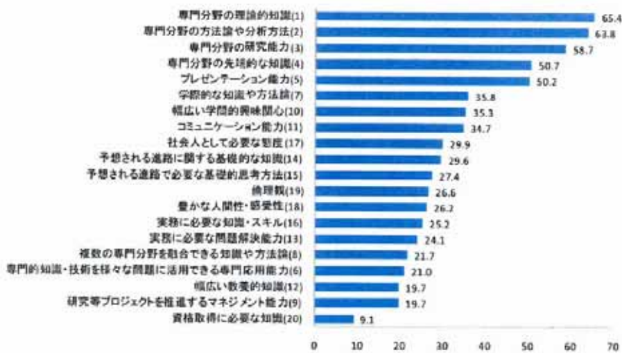
博士（後期）課程修了時に身につけていると見込まれる知識・技能・能力 （未来工学研究所（2009））