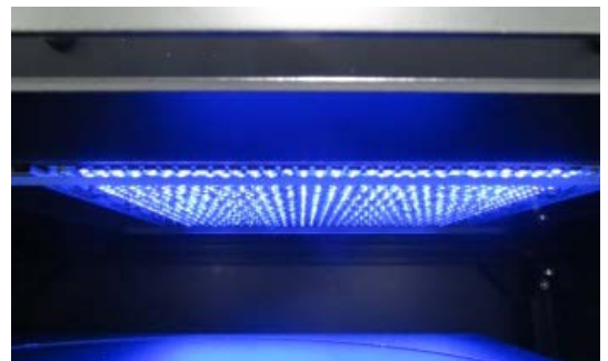
樹脂硬化用DUV-LEDアレイモジュール (50x50mm 2 )