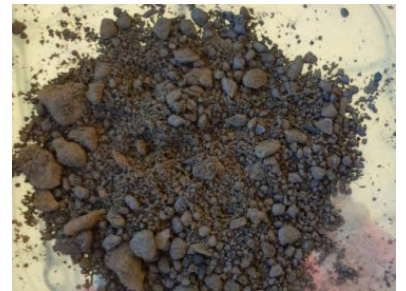
焼却灰の造粒固化物