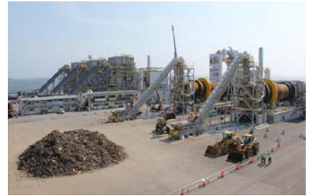
災害廃棄物中間処理施設(焼却施設)