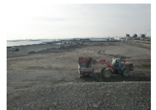
造粒固化物の石巻港埋立材としての利用状況