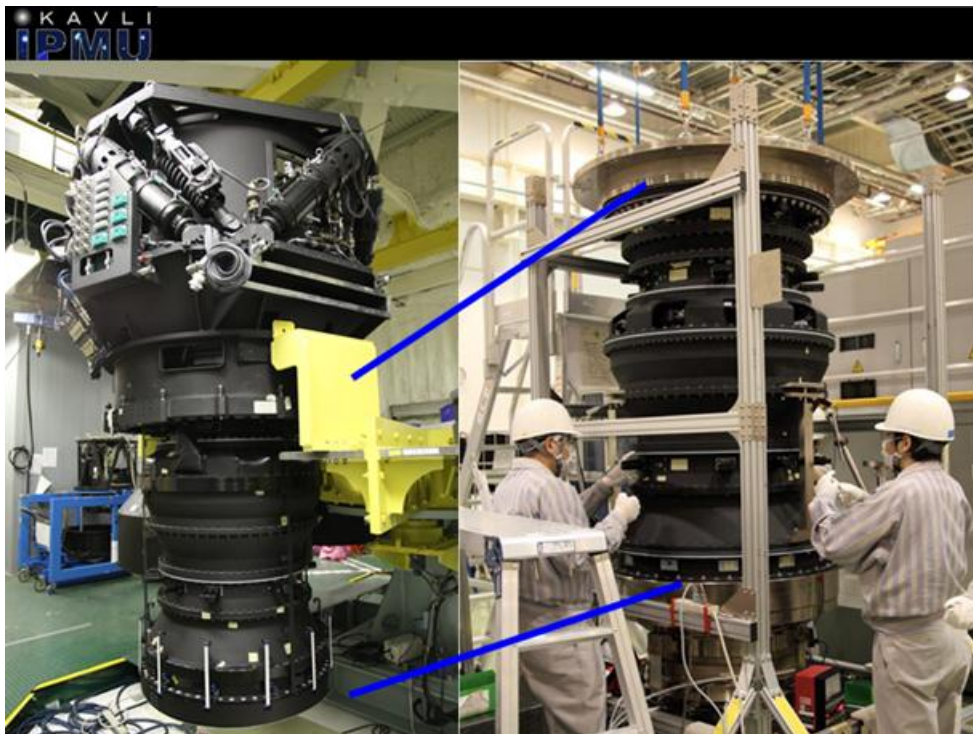
図 1. すばる主焦点超広視野カメラ（ハイパー・シュプリーム・カム）