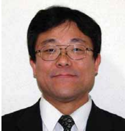
ImPACT Program Manager