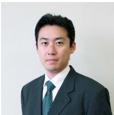
ImPACT Program Manager