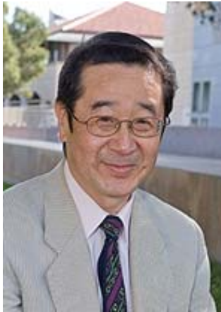
ImPACT Program Manager