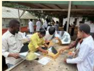
図1. ソーラークッカーの組立