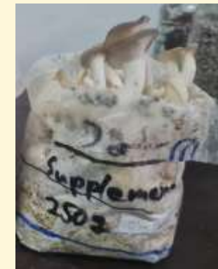
図3. ソーラークッカーで滅菌したサンプル