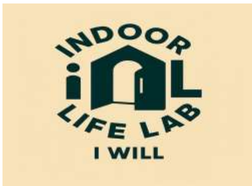
Indoor Life Lab ロゴマーク

本提案「インドアライフ研究所」は、日本のひきこもり支援におけるパラダイムシフトを促す可能性を秘めている。それは、従来の受動的な「援助」モデルから、当事者が主体となる能動的な「エンパワメントモデル」への転換である。加えて、自治体の既存のメタバースモデルが「つながりの創出」に主眼を置くのに対し、本研究所はそこから一步踏み込み、「つながる」と「稼ぐ」と「学ぶ」を一つのサイクルの中で実現する。これにより、単発の支援ではなく、当事者が自らの力で人生を再設計していくための長期的な支援になると考えている。