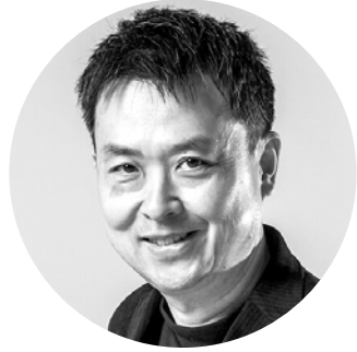
リーダー：松隈浩之 (九州大学准教授/ 3DCG、 ゲーミフィケーション)