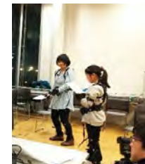
VRシステムデザイン