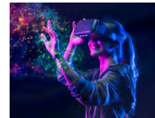
コミュニケーションデザイン