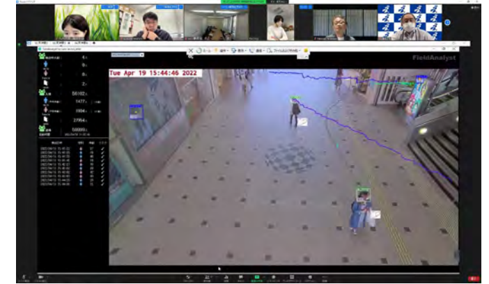
福岡市・MDC・NECとの研究会を既に月に1度実施

都市のデジタル化国際セミナー（ドイツ・ドレスデン工科大学、ノルウェー科学技術大学、中国・浙江大学）を企画・開催