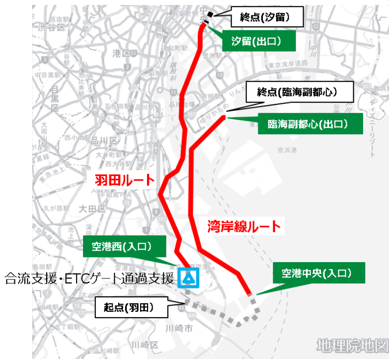
【羽田空港と臨海副都心等を結ぶ首都高速道路】