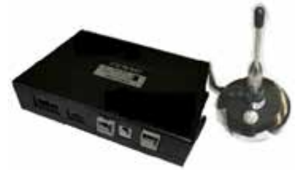
ITS 無線受信機（車載器）