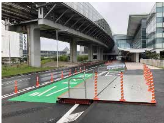
羽田空港第3ターミナル