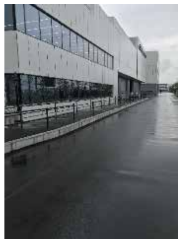
羽田空港跡地第1ゾーン内