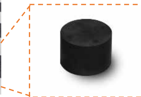
磁気マーカー（愛知製鋼㈱提供）