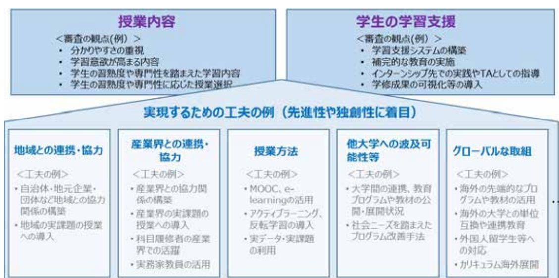
図 3 「認定教育プログラム + (プラス)」の評価軸及びその工夫の例

これらの項目を全て満たす必要はないが、大学等の特徴を踏まえてこれらを有効に組み合わせ、注目すべき取り組みを行い、実績をあげていることが重要である。