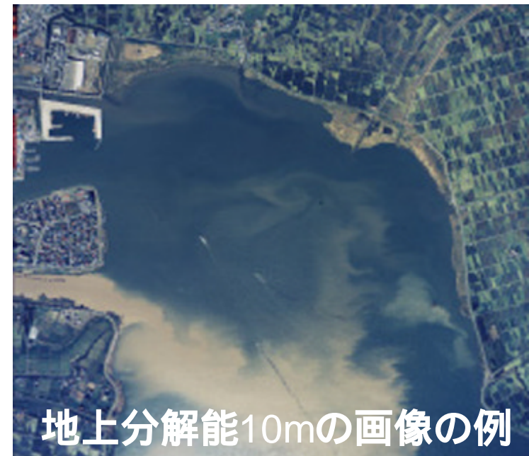
地上分解能10mの画像の例