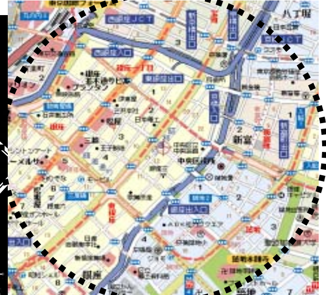
中央区銀座周辺地図