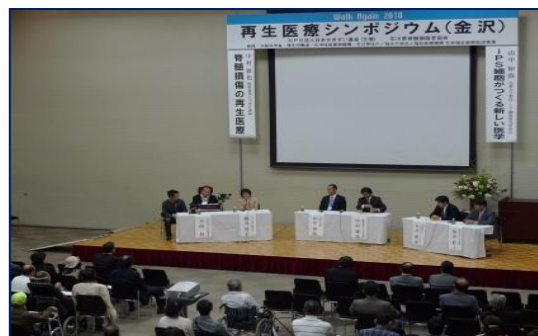
【患者団体等イベント参加】