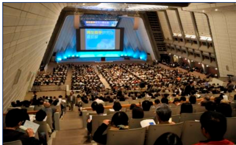
【市民対象公開シンポジウム】 H21年度よりiPS細胞等研究ネットワーク合同 シンポジウム