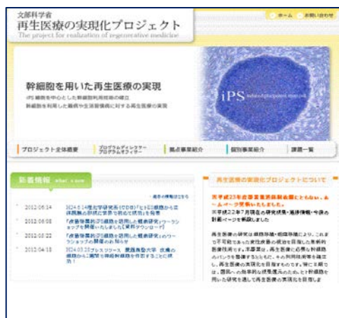
【ホームページ運営】