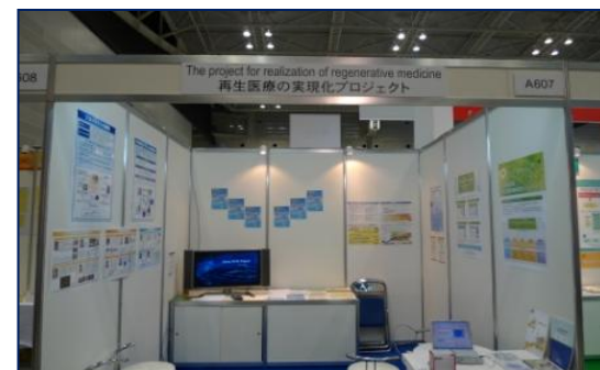
【関連展示会等ブース展示】