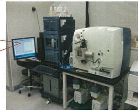
培養液の測定、天然化合物の検出