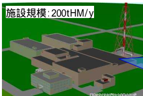
施設規模: 200tHM/y 燃料サイクル施設