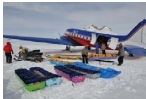
航空機による観測

地質学的研究としては、東西 Gondwana の会合部とされる東ドロンニングモードランド一帯を調査対象地域とし、10億及び5億年前の超大陸の形成に関わる変動の履歴と要因を解明する調査・研究を進める。