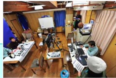
昭和基地 (南極 東オングル島)

昭和基地と日本の小中学校の教室をインテルサットの常時回線を活用し年間約30~40回実施