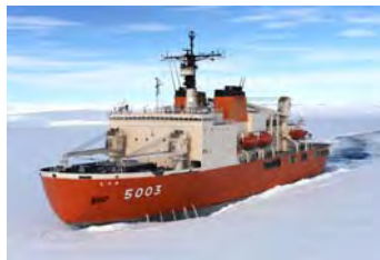
南極観測船「しらせ」