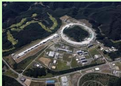
マイクロビーム ビームライン (SPring-8)