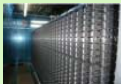
化合物ライブラリー (東大創薬オープン イノベーションセンター)