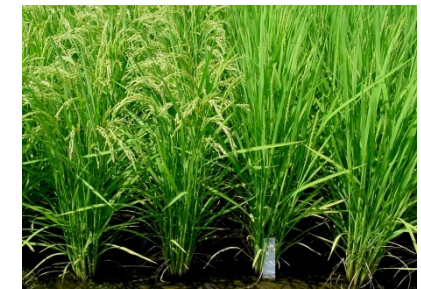
コシヒカリ関東HD1号 コシヒカリ