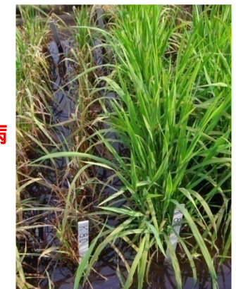
コシヒカリ(罹病性) 中部128号(抵抗性)