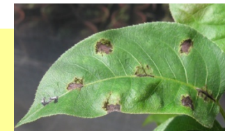
ナシ黒星病罹病性

理由: イネ、コムギ、ダイズ、ハクサイ、ナシ等で病害抵抗性等の実用的なDNAマーカーを開発し、イネやダイズについては出穂性や病害抵抗性を導入した同質遺伝子系統を育成したため。また、マーカー育種法開発のための新解析法を開発し、各品目でSSRマーカーやSNPマーカーを開発したため。