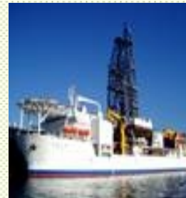
地球深部探査船「ちきゅう」

衛星や海洋探査技術による全球的な観測・監視技術の開発を行うとともに、これらの観測データを社会的・科学的に有用な情報に変換し提供