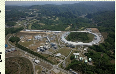
X線自由電子レーザー(左奥の直線状の建物) 右の円は大型放射光施設SPring-8

原子レベルの超微細構造や化学反応の超高速動態・変化を瞬時に計測・分析が可能な世界最高性能の研究施設を整備し、欧米に先んじる成果を創出