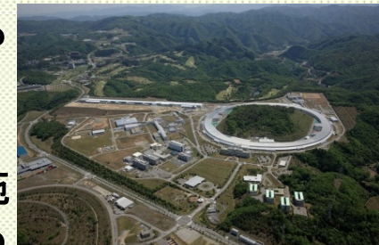
X線自由電子レーザー(左奥の直線状の建物) 右の円は大型放射光施設SPring-8

原子レベルの超微細構造や化学反応の超高速動態・変化を瞬時に計測・分析が可能な世界最高性能の研究施設を整備し、欧米に先んじる成果を創出