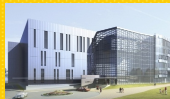
次世代スーパーコンピュータ施設のイメージ

世界最高水準を目指した次世代スーパーコンピュータ(1秒間に1京回の計算性能)を平成22年度末の一部稼働、平成24年の完成を目指して開発するとともに、利用のためのソフトウェアの開発を推進