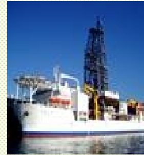
地球深部探査船「ちきゅう」

衛星や海洋探査技術による全球的な観測・監視技術の開発を行うとともに、これらの観測データを社会的・科学的に有用な情報に変換し提供