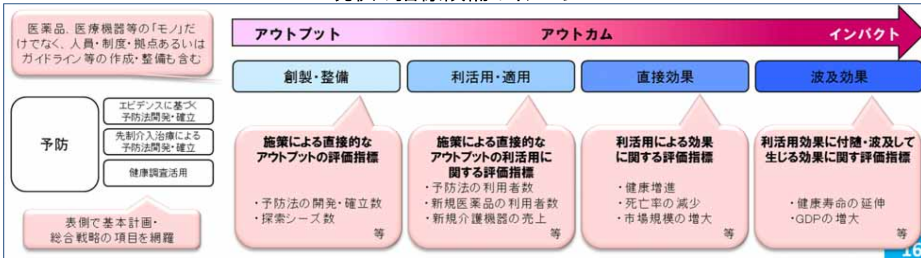
現状の指標候補のイメージ